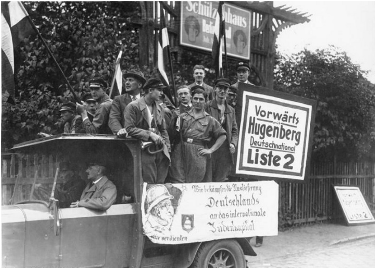
Передвиборна кампанія Німецької національної народної партії під антисемітськими гаслами

На початку 1920-х Німеллер планував стати фермером, але оскільки грошей на придбання садиби не вистачало, вирішив вивчати протестантське богослов'я. Це не завадило йому вступити в 1924-му в НСДАП. У 1931 році священника призначили пастором євангельської громади престижного берлінського району Далем. Він як і раніше підтримував нацистів, вважаючи, що Німеччині потрібна сильна рука. У той час приблизно половина німців сповідували католицизм, і стільки ж було протестантів-лютеран. Протестантська церква явно грала на боці НСДАП, у той час як серед католиків було більше опозиціонерів. Пастора навіть хвалять у партійній пресі за військове минуле й нацистське сьогодні.