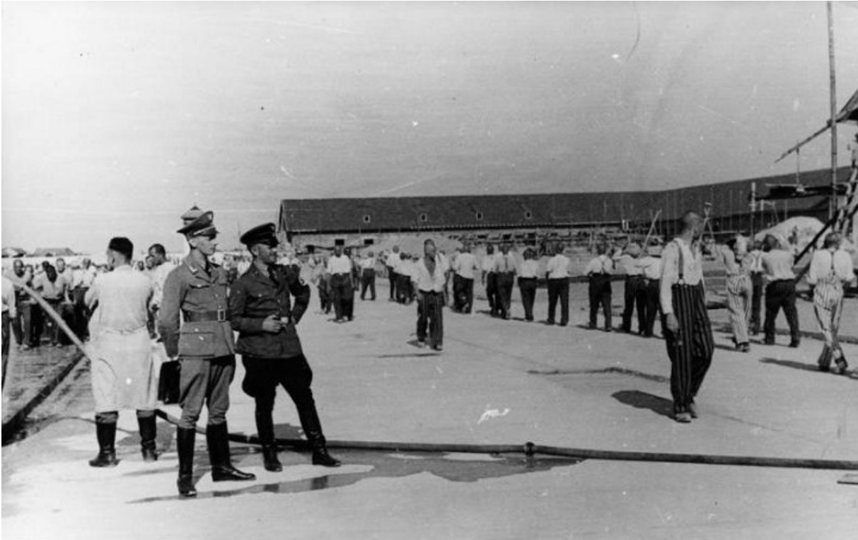
Концтабір Заксенхаузен, 1938

Незважаючи на це 1 липня 1937 року Німеллера знову заарештували — до того моменту на нього завели вже приблизно 40 справ. Його арешт викликав хвилю солідарності всередині країни і за межами Німеччини. 7 лютого 1938 року пастора засудили до семи місяців тюремного ув'язнення, які він уже відбув до суду. Але вийти на свободу Мартіну не дали — засуджений був тут же знову заарештований гестапо і відправлений до концтабору Заксенхаузен як «особистий полонений» Адольфа Гітлера.