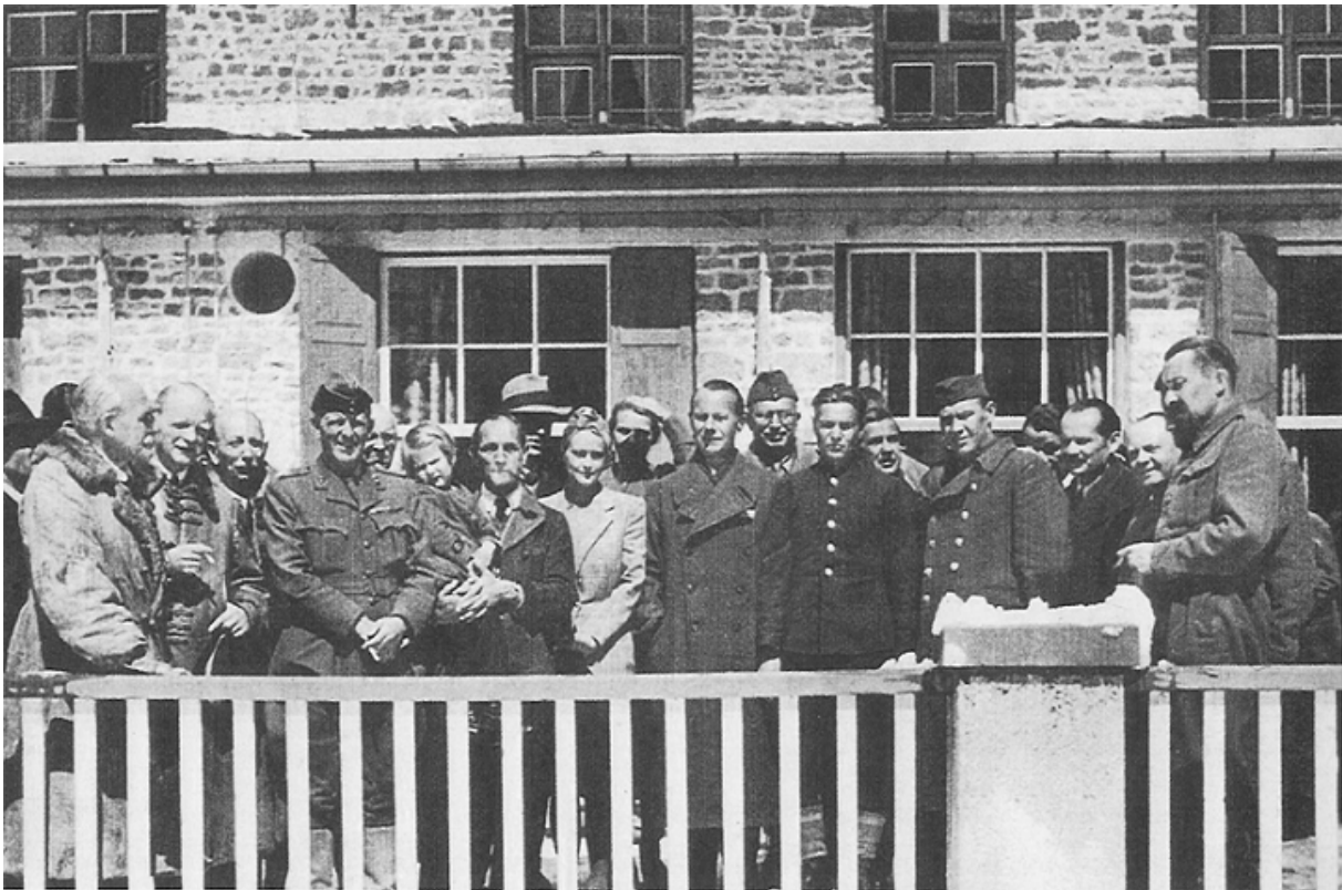
Пастор Німеллер (з трубкою в роті і дитиною на руках) після звільнення из Дахау, 5 травня 1945

Під час ув'язнення теологічний підхід Німеллера зазнав змін. Він визнав розп'яття Ісуса Христа подією для всіх народів, стверджуючи, що церква, насамперед, має працювати над подоланням кордонів, рас та ідеологій. Він також усвідомив роль, яку відіграла церква в узурпації влади націонал-соціалістами.