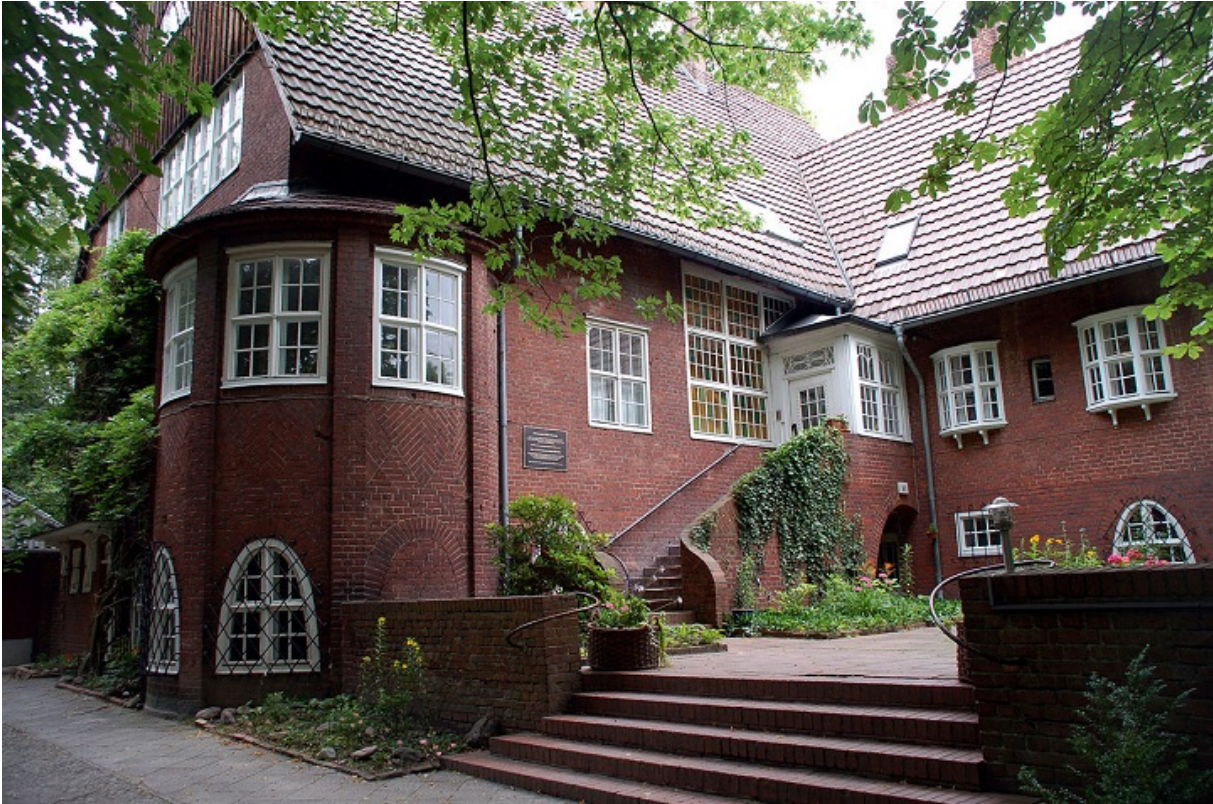
Будиноу-музей Мартіна Німеллера у кварталі Далем

У цей час священник усе частіше розглядає політичні рішення з теологічної точки зору. Питання «Що Ісус сказав би з цього приводу?» стало для нього визначальним.