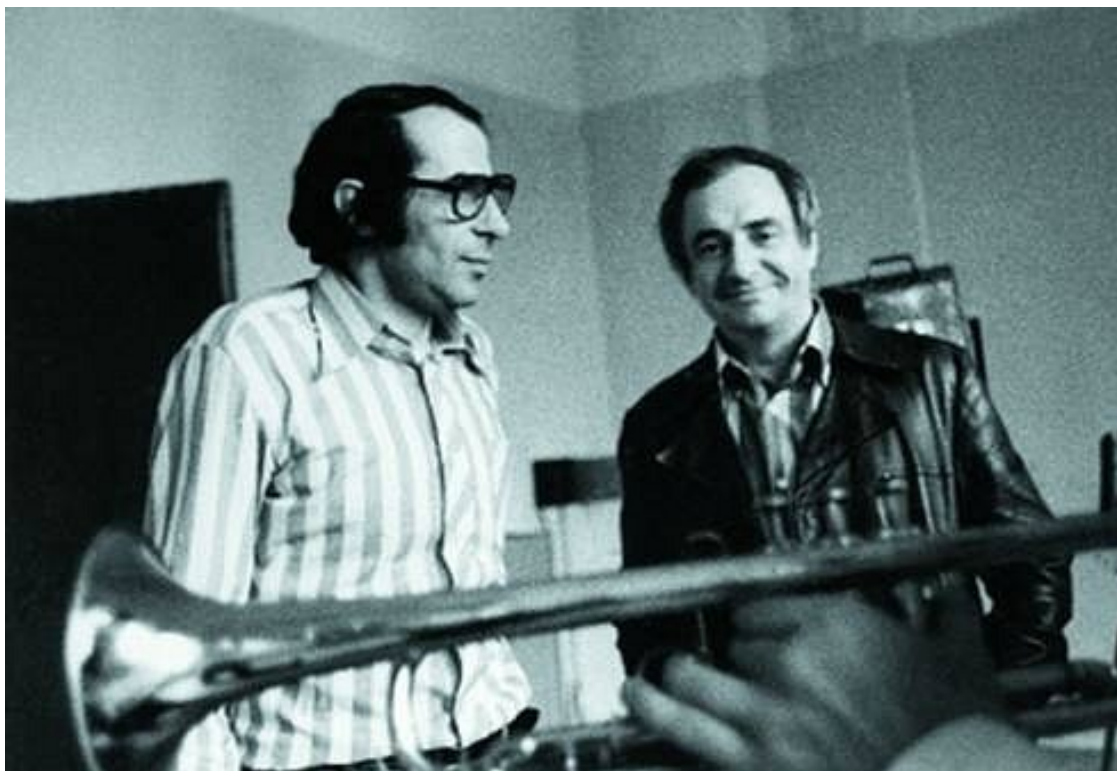
С Марком Захаровым в театре «Ленком»

У меня есть несколько стихотворений на еврейские темы, пьеса-либретто. В стихах «Звёзды блуждают...» по мотивам Шолом-Алейхема со ставшей широко известной арией «Каждый еврей — король». Кроме того, я перевел с испанского и английского несколько десятков стихотворений, затрагивающих эту тему, в том числе — поэта XIV века раввина Шем Това из Карриона — первого еврея, замечательно писавшего на испанском языке.