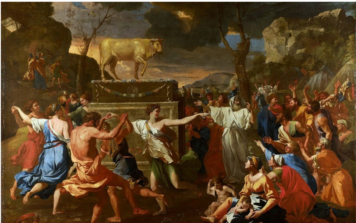
Пляски вокруг золотого тельца, худ. Никола Пуссен, 1633 - 1637

Великий еврейский мистик Баал Шем Тов считал наиболее милыми для Господа обычных евреев — простэ идн. Среди них настроения двойственные. С одной стороны, афера Мэдоффа — это шанде — еврейское слово, означающее позор, причем, публичный. С другой — многие вспоминают, каким Берни был а-мэнч, человеком с большой буквы, как не любил себя выпячивать, как щедро жертвовал на Израиль и помогал «бедным» богатым вдовам и сиротам. Рассказывают, как он содержал пожилую вдову одного из первых вкладчиков, бродит также история о щепетильных Берни с женой, раскладывающих в почтовые ящики соседей извинения за неудобства, доставленные аферой.