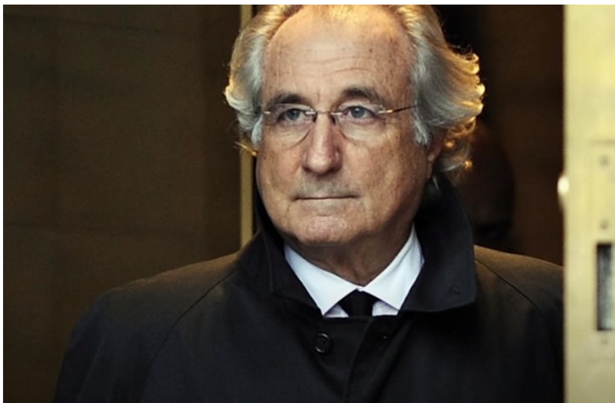
Берни Мэдофф.