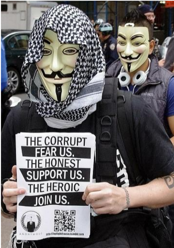
На митинге Occupy Wall Street