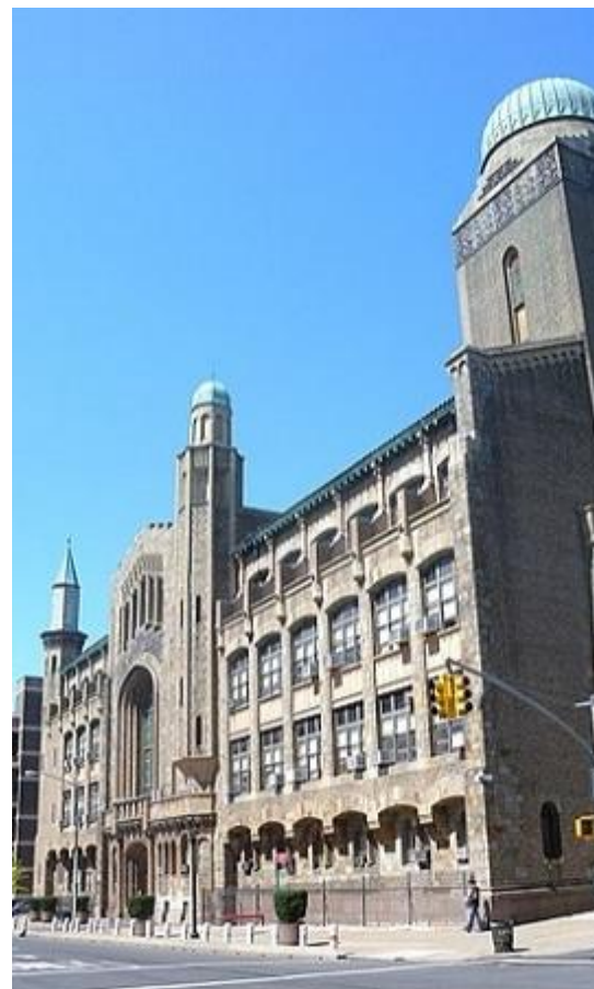
Yeshiva University, Нью-Йорк

Дело в том, что исчезает само понятие «еврейских денег». Еврейские банки, как и еврейские больницы, или адвокатские конторы имели смысл в эпоху системного антисемитизма, когда в Америке евреев-врачей действительно не принимали в больницы, и не давали ссуды бизнесменам-евреям. С 1970-х годов евреи — одна из самых успешных этнических групп в США, поэтому нынешний антисемитизм носит далеко не «системный» характер.