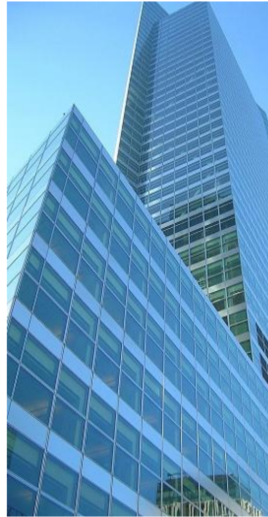
Штаб-квартира Goldman Sachs, Манхэттен