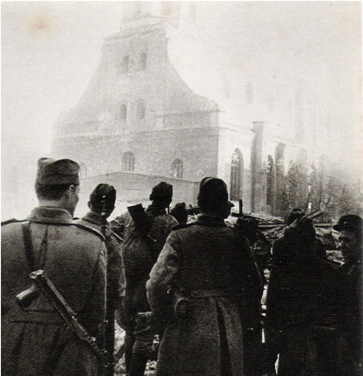
В освобожденной Риге, 1944