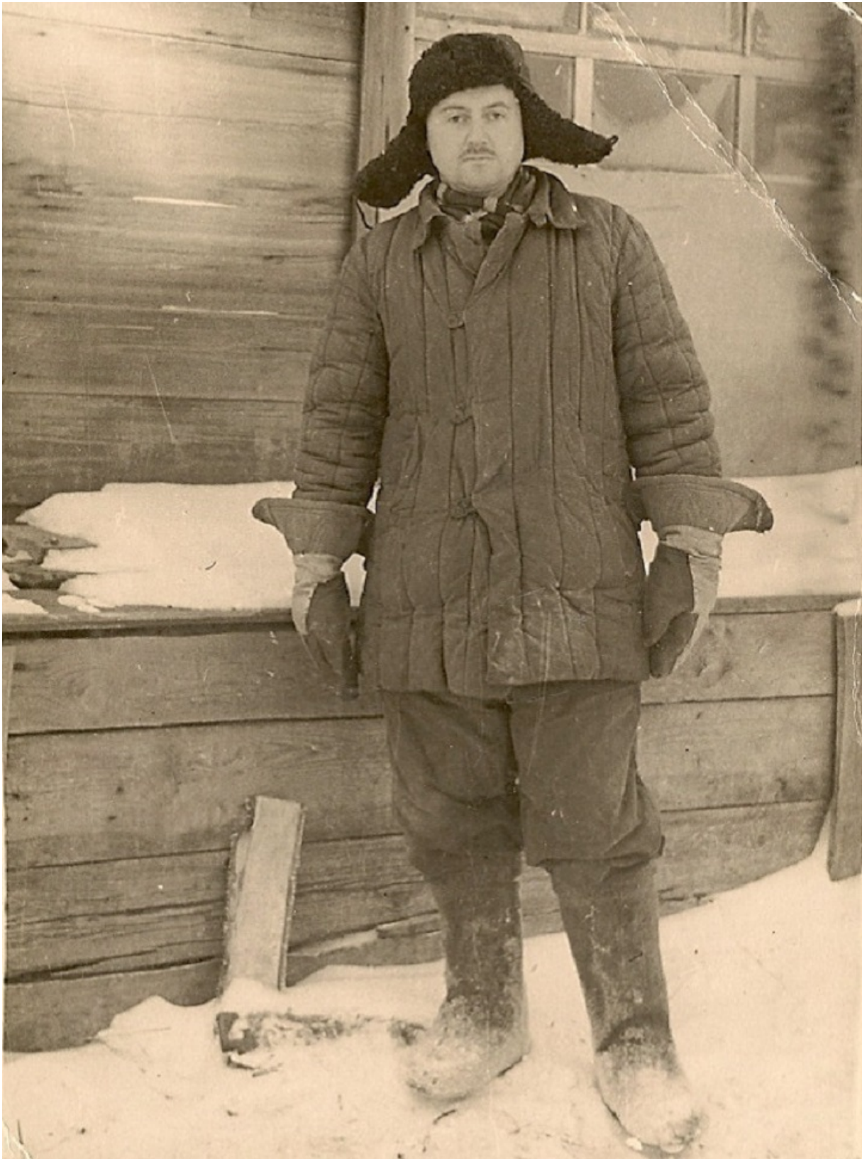
В мордовском лагере, 1960