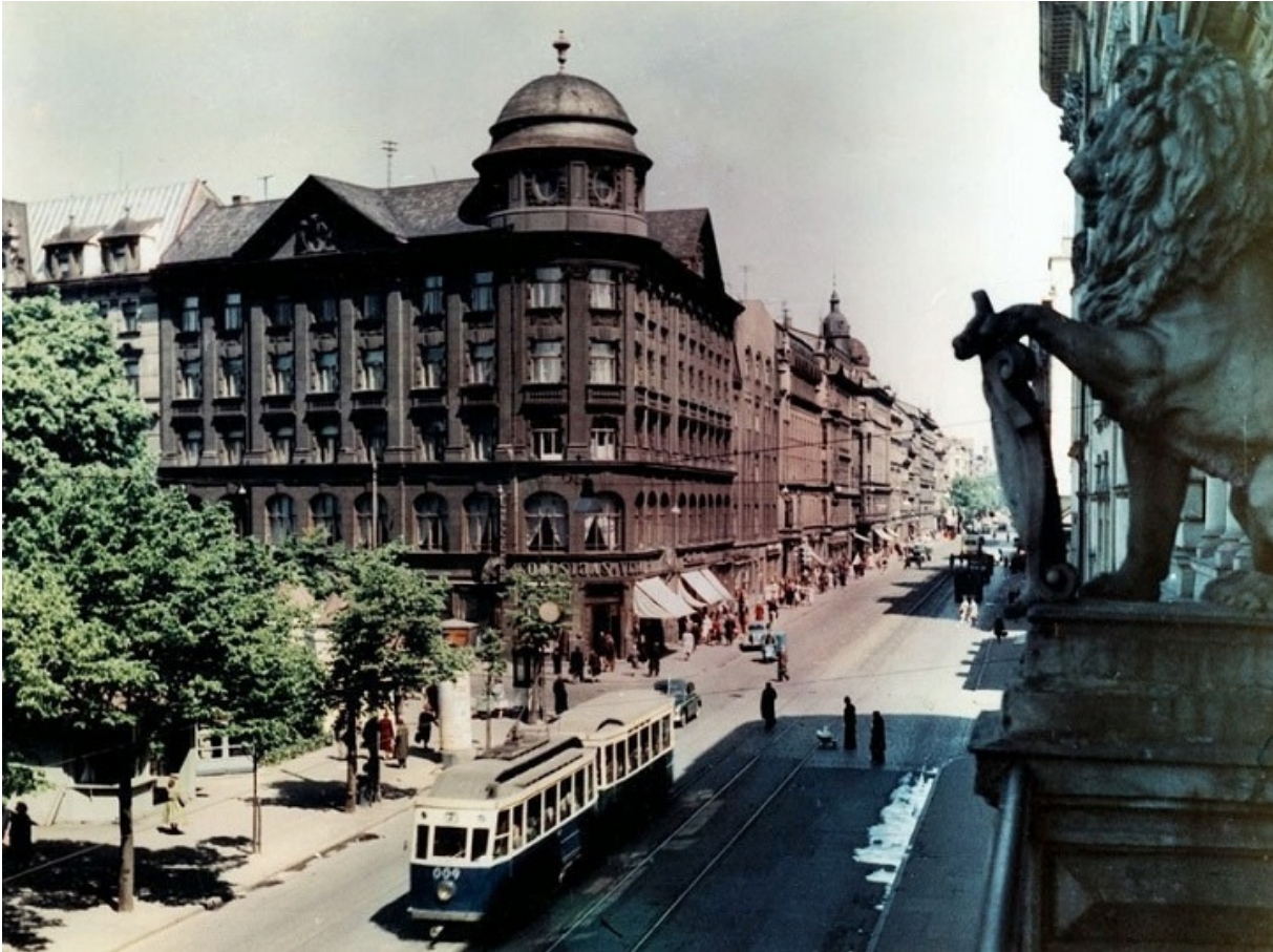
Рига, 1950-е годы